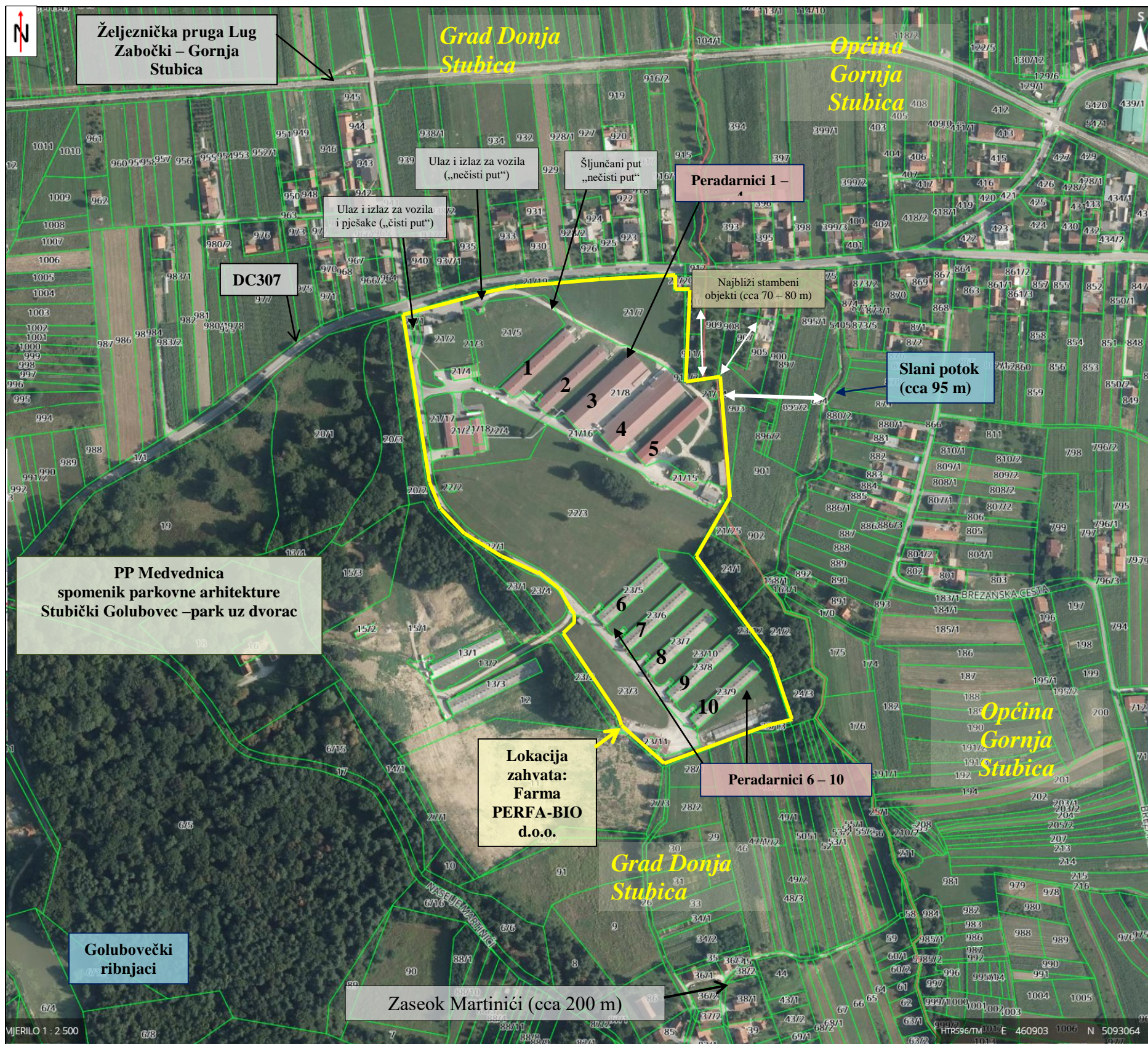
Prilog 2: Pregledna karta lokacije planiranog zahvata